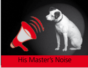
His Master's Noise

In zwei Sportarten sind wir Eidgenossen unschlagbar: Im Tennis und im Geld scheffeln. Das Erste überlassen wir Roger. Das Zweite übernehmen wir selbst. Wenn irgendwo Zaster herumliegt, packen wir zu und füllen den Speicher. Woher die Kohle kommt und was immer daran klebt – Augen zu, Schwamm drüber, und schon ist die Kohle blank. Vordergründig spielen wir gern den Friedensapostel, mal in Genf, mal im FIFA-Tempel auf dem Züriberg. Hat der silberne Glimmer des Mammons aber unsere Pupillen erfasst, vergessen wir alle Vorsätze und opfern sie unserem Prinzip.